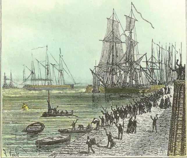
« LE DELPHIN » S'ÉBRANLA, PASSA ENTRE LES NAVIRES DU PORT. (Page 126.)

souvent au milieu de passes fort étroites. Inconvénient de peu d'importance ; pour une rivière navigable, en effet, mieux vaut la profondeur que la largeur. Le steamer, guidé par un de ces excellents pilotes de la mer d'Irlande, filait sans hésitation entre les bouées flottantes, les colonnes de pierre et de biggins surmontés de fanaux qui marquent le chenal. Il dépassa bientôt le bourg de Renfrew. La Clyde s'élargit alors au pied des collines de Kilpatrick, et devant